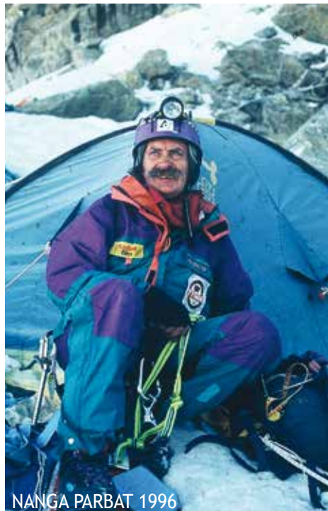
NANGA PARBAT 1996