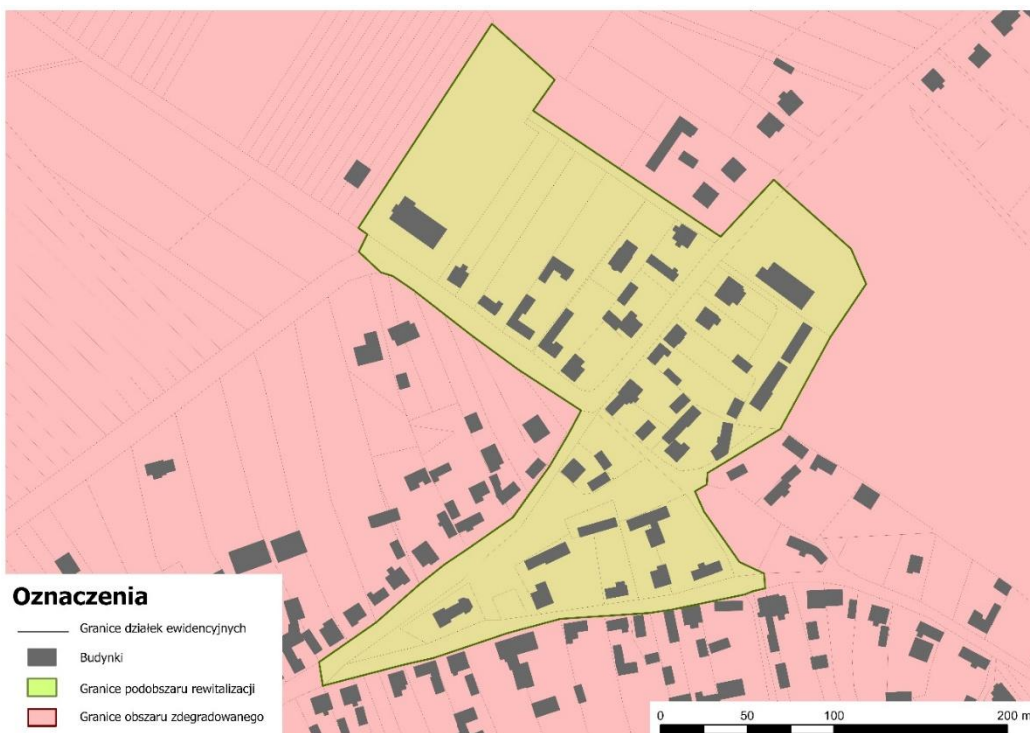
Rycina 3. Obszar rewitalizacji Miasta i Gminy Włodowice – Podobszar 3 ZDÓW. Podkład: Baza Danych Obiektów Topograficznych BDOT 10k.