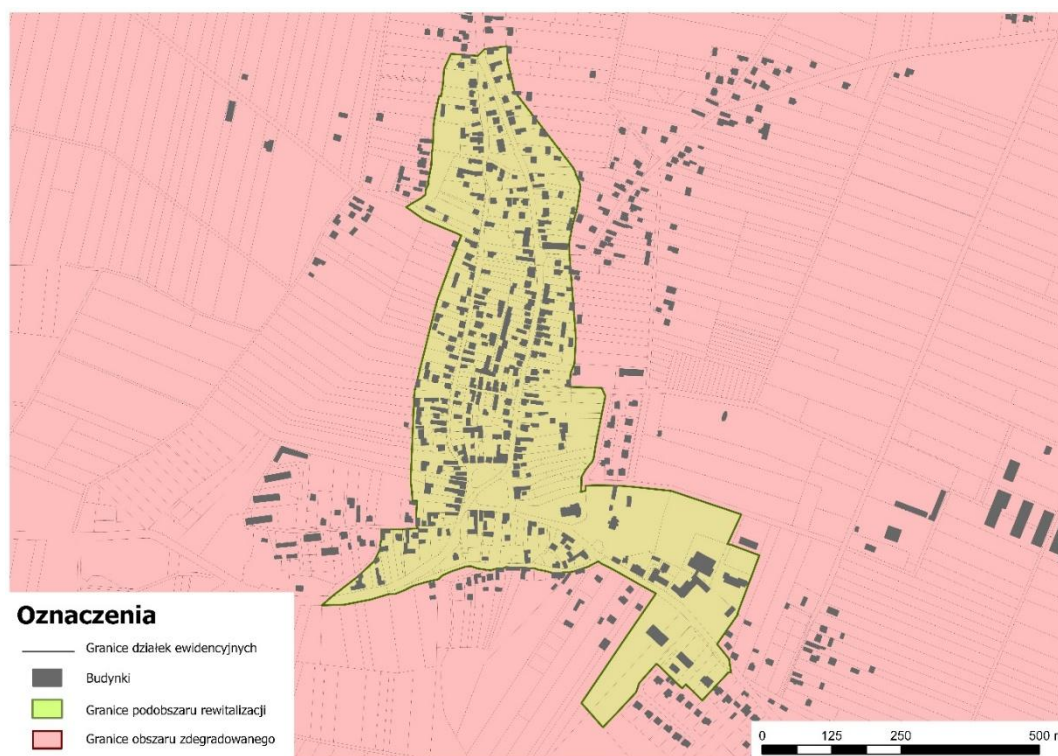
Rycina 1. Obszar rewitalizacji Miasta i Gminy Włodowice – Podobszar 1 WŁODOWICE. Podkład: Baza Danych Obiektów Topograficznych BDOT 10k.